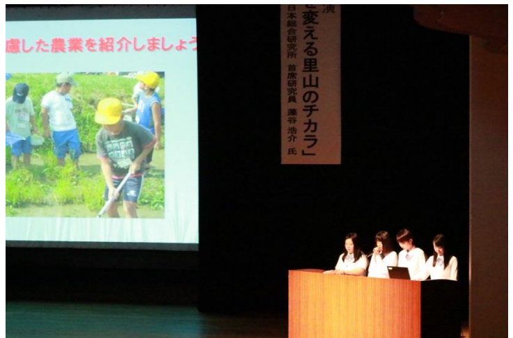
事例発表 新潟県立佐渡総合高等学校