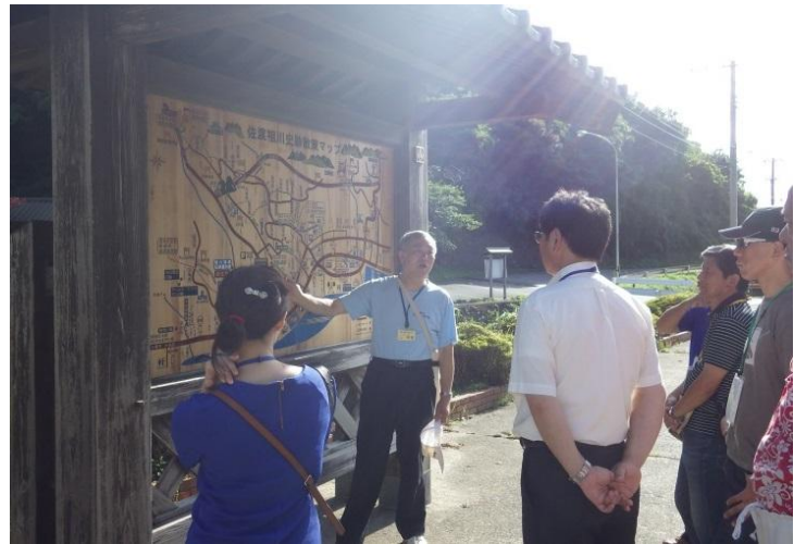
A : 相川中学校ガイドと佐渡金山近代化遺産