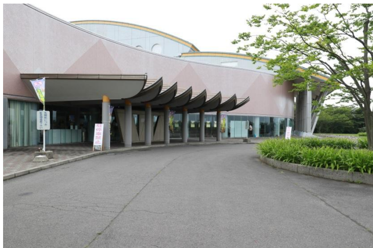
メイン会場（アミューズメント佐渡）正面