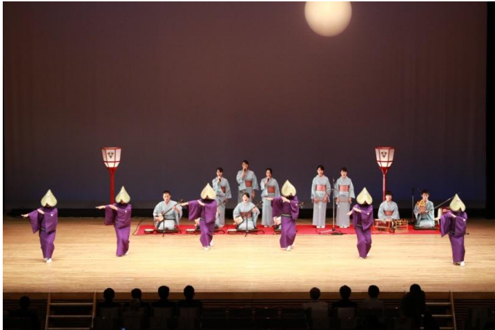
新潟県立羽茂高等学校 郷土芸能部 芸能発表