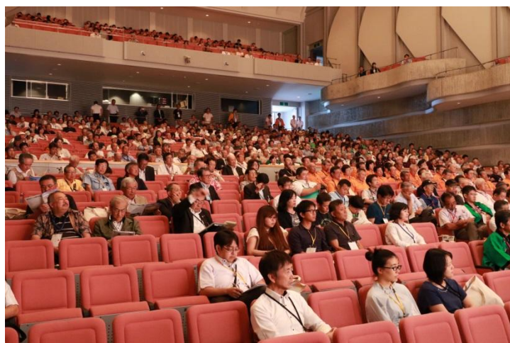
アミューズメント佐渡 大ホール