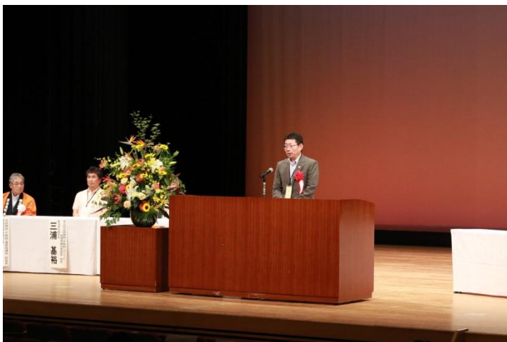
開催地歓迎の挨拶 新潟県副知事