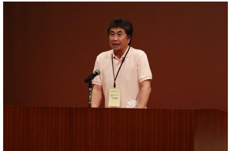
全国棚田（千枚田）連絡協議会 副会長（佐渡市長）挨拶