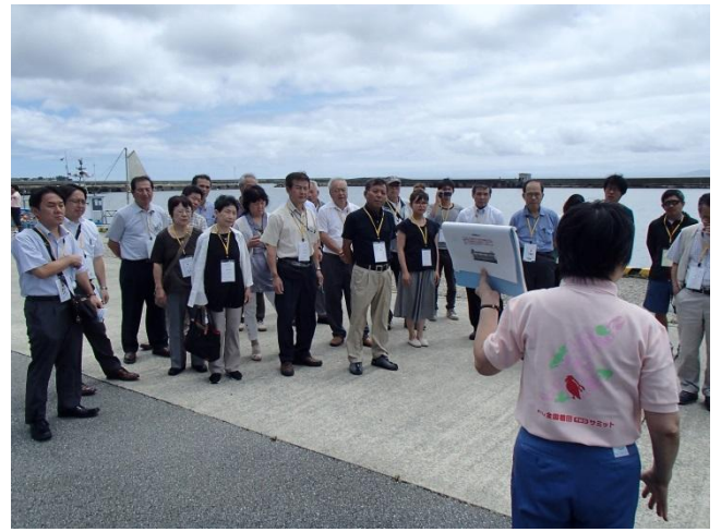
バスで巡る佐渡の里山里海コース