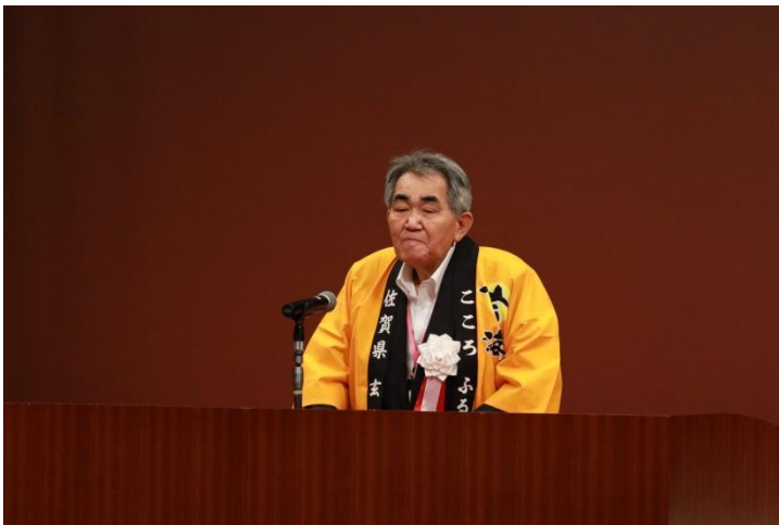
全国棚田（千枚田）連絡協議会 会長（玄海町長）挨拶