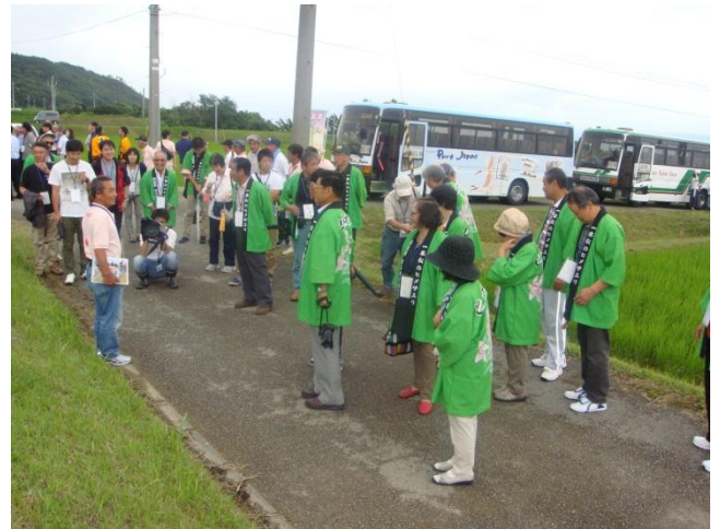
北片辺棚田コース