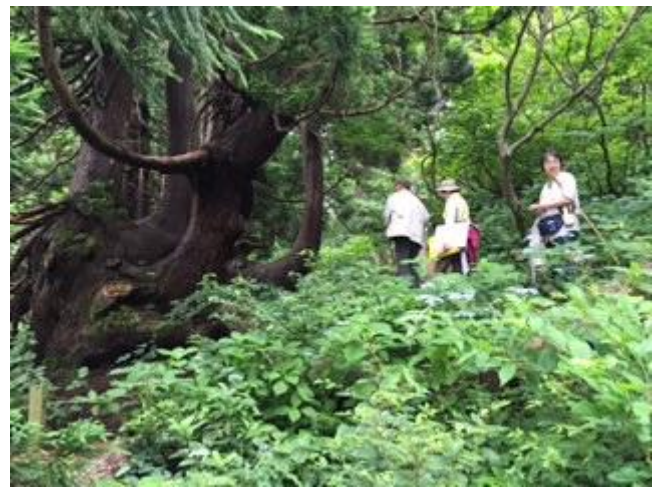
G : 高千中学校文弥人形と天然杉ハイキング