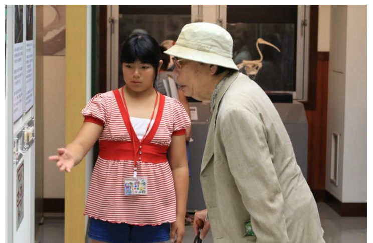
C : 行谷小学校トキガイドとトキ野生復帰