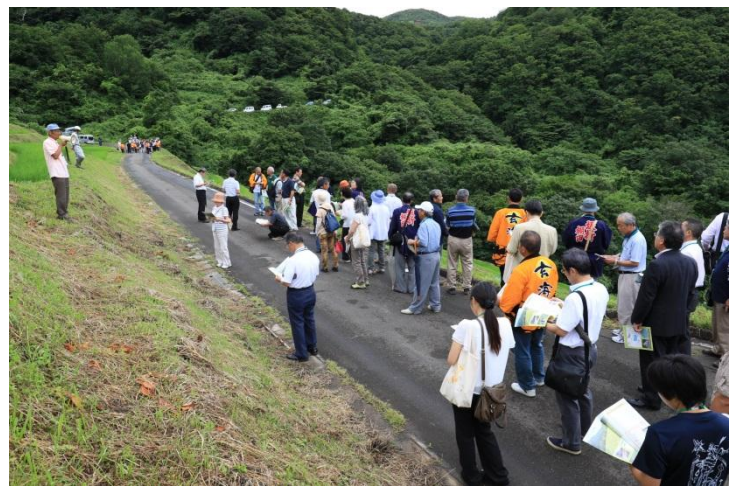
小倉千枚田コース