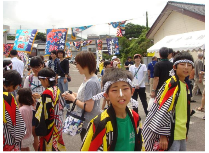
F : 名物！漁師町姫津のイカイカ祭り見学