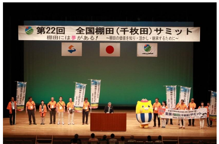
次回開催地（長崎県波佐見町）の挨拶