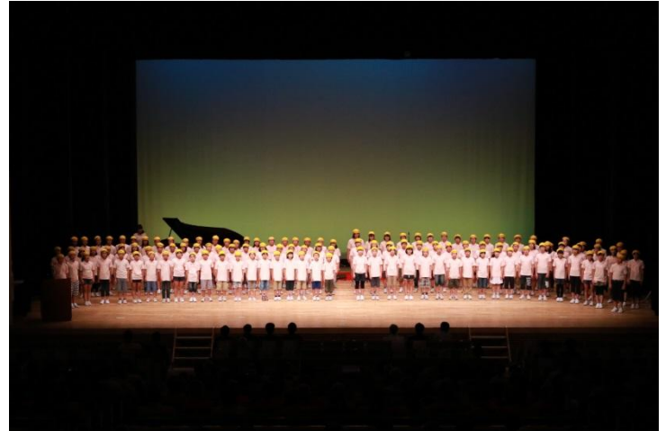
佐渡市立金井小学校 5・6年生 合唱