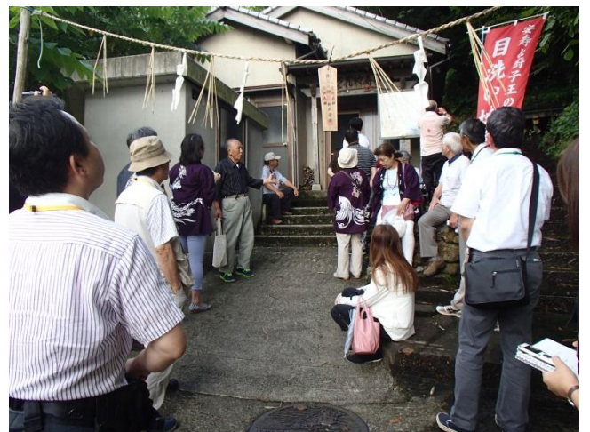
B : 尖閣湾見学と民話語り