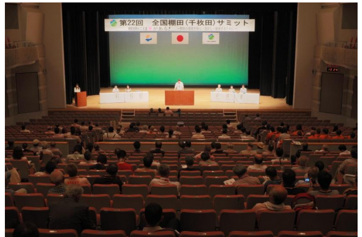
座長による分科会のまとめの発表